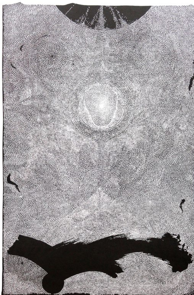
Kiedy Anioł upada , 2010 (linoryt) 88,7 x 57,2 cm, własność Autora

Prace w zbiorach: Biblioteki Narodowej w Warszawie, Biblioteki Uniwersyteckiej w Łodzi, Muzeum Okręgowego w Jeleniej Górze, Muzeum Regionalnego w Kutnie, Miejskiej Galerii Sztuki w Łodzi, Mazowieckiego Centrum Sztuki Współczesnej w Radomiu, Muzeum Miasta Ostrowa Wielkopolskiego, Muzeum Okręgowego im. J. Chełmońskiego w Bydgoszczy, Musashino University Museum w Tokio.