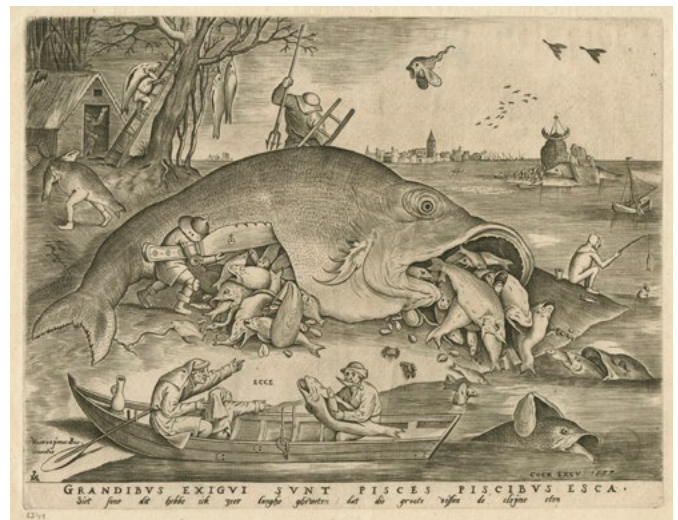
Wielkie ryby pożerające małe ryby, Pieter van der Heyden według Pietera Bruegela Starszego, miedzioryt, 1557, źródło: PAUart

PAUza Akademicka – www.pauza.krakow.pl – tygodnik Polskiej Akademii Umiejętności i środowiska naukowego.