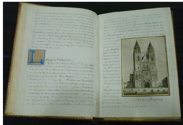
Fragment pamiętnika podróży po Europie ks. Dorothei von Sagan (Dorothei de Sagan) – opis spotkania w Lipsku w 1852 r. z Aleksandrem von Humboldem.

W samej konferencji udział wzięło 45 specjalistów z ośrodków akademickich w Polsce, USA, Niemczech i Austrii. Rozmawiano o historii listu kobiecego, jego obecności w kulturze, materialności, estetyce i poetyce, poruszano problematykę literackości i funkcjonalizowania listu, a także kwestie edycyjne. Konferencja zorganizowana została wspólnie przez instytuty germanistyczne Uniwersytetu Jagiellońskiego oraz Uniwersytetu Śląskiego w partnerstwie z Biblioteką Jagiellońską oraz Uniwersytetem w Lipsku, a także we współpracy z Interdyscyplinarnym Zespołem Badawczym „Badania nad Kulturą Dawną”. – Wybrana przez organizatorów data 1750 jest umowna, ale nieprzypadkowa. Wraz z Oświeceniem i coraz szerszym uczestnictwem kobiet w życiu intelektualnym,