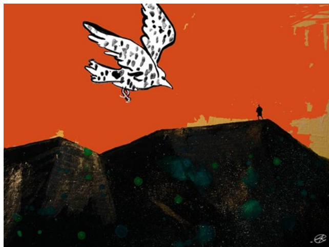
Wszystko zależy od skali Rys. Adam Korpak

PAUza Akademicka – www.pauza.krakow.pl – tygodnik Polskiej Akademii Umiejętności i środowiska naukowego.