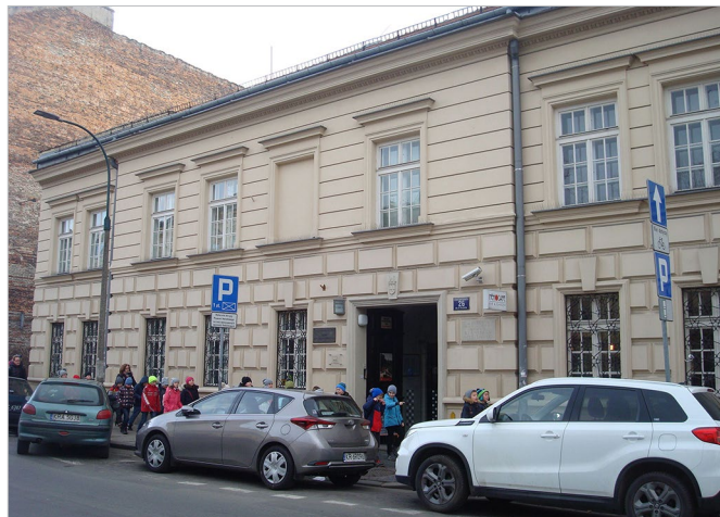
Kraków, ul. Krupnicza 26.